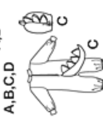
A, B, C, D